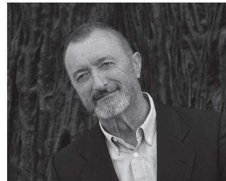
ARTURO PÉREZ-REVERTE