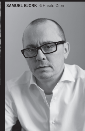
SAMUEL BJORK