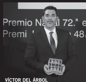
VÍCTOR DEL ÁRBOL