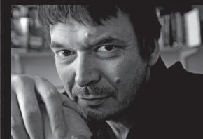
IAN RANKIN © Orion Books