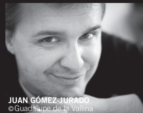
JUAN GÓMEZ-JURADO © Guadalupe de la Vallina