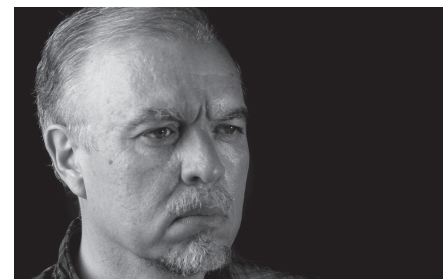
JORGE FERNÁNDEZ DÍAZ